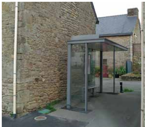
L'arrêt de bus

Les courbes et les différentes parties d'évolutions de l'aire de glisse universelle ont été dessinées et le projet commencera à sortir de terre à partir du premier trimestre 2019.