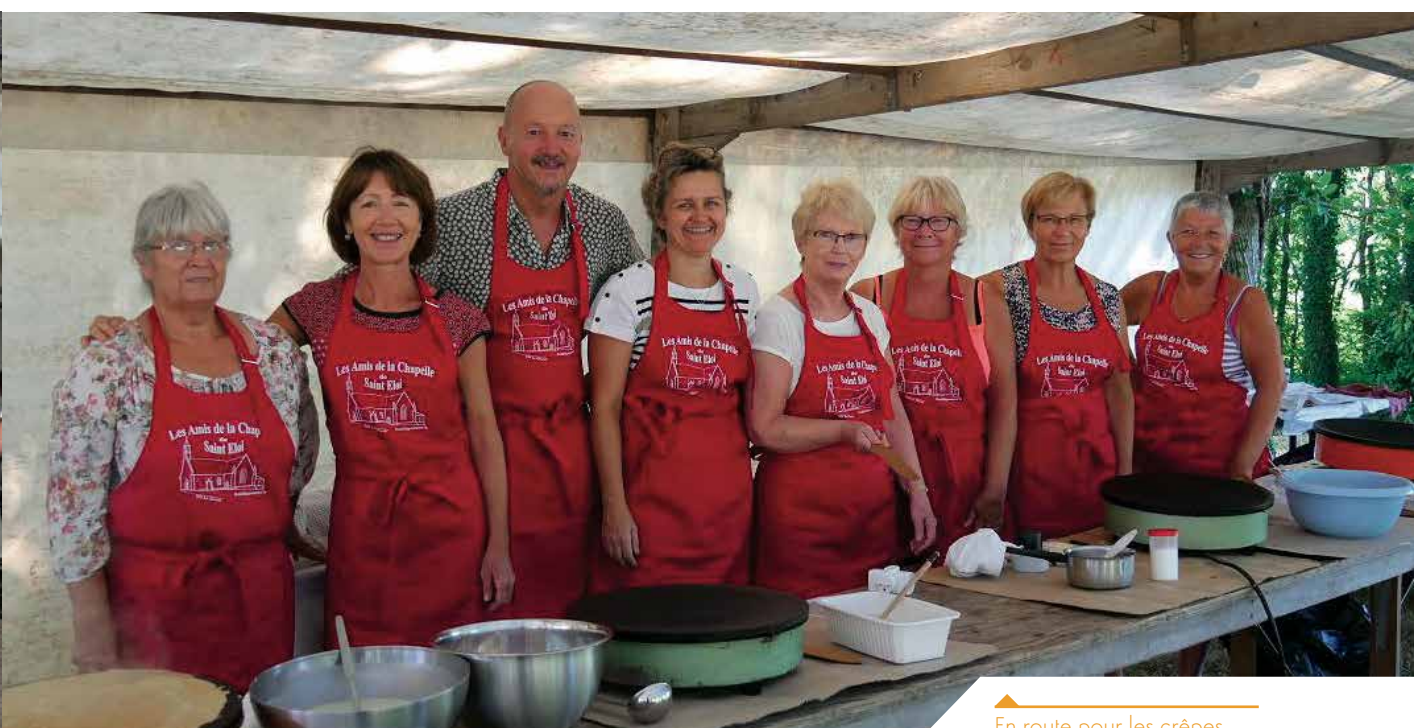
En route pour les crêpes