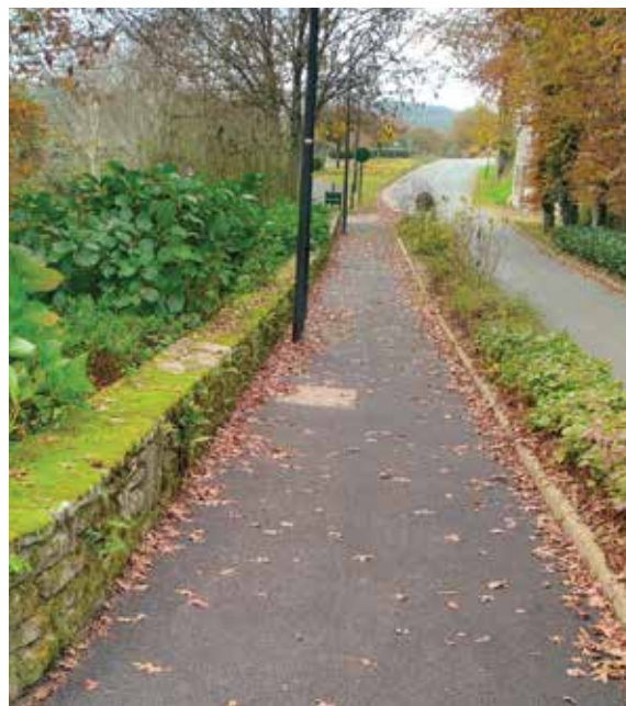
Le chemin bitumé