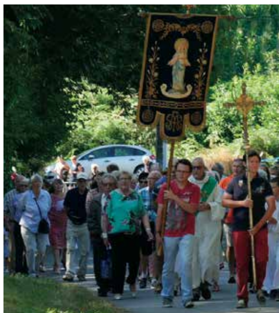
Le procession du pardon

L'année 2018 a connu une activité très dense grâce à la participation et au soutien de l'ensemble des bénévoles :