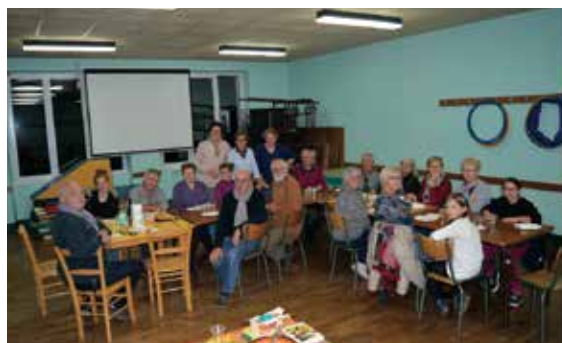
La récompense des bénévoles