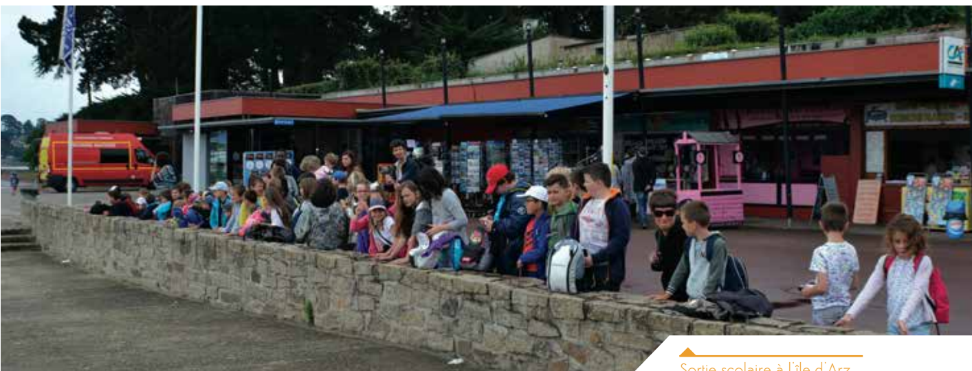
Sortie scolaire à l'île d'Arz