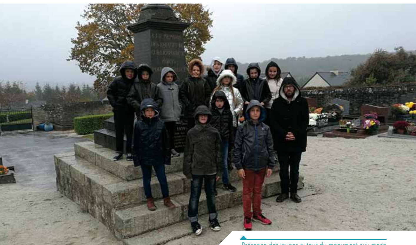
Présence des jeunes autour du monument aux morts