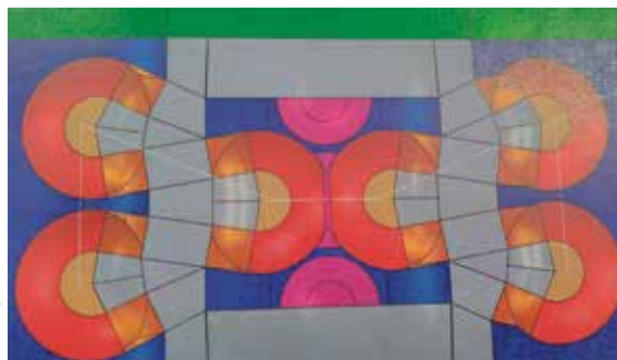
L'air de glisse