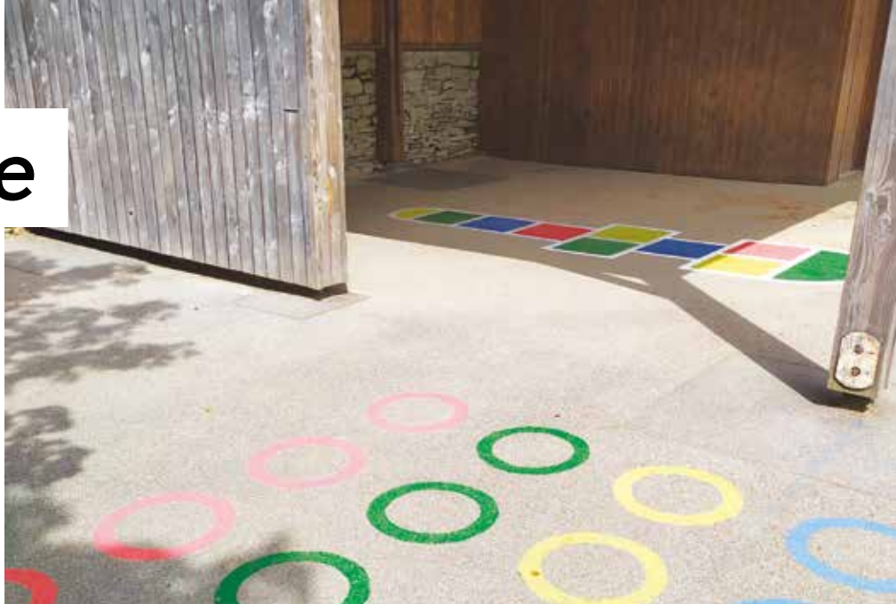
2 nouvelles marelles dans la cour de l'école.