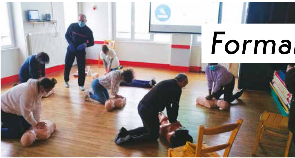
Formation en cours pour les agents communaux