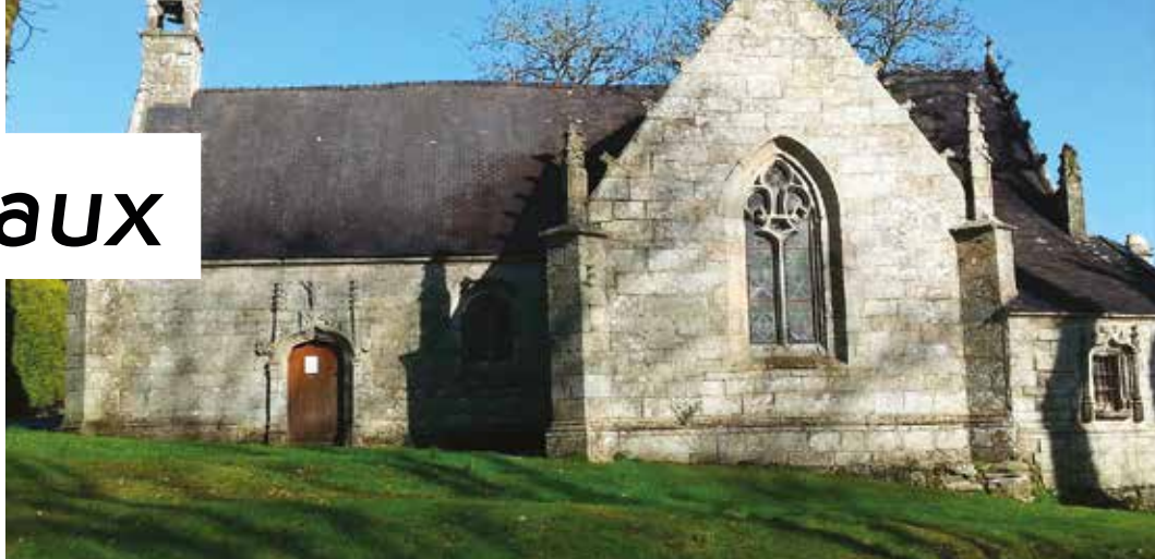
Chapelle St Eloi