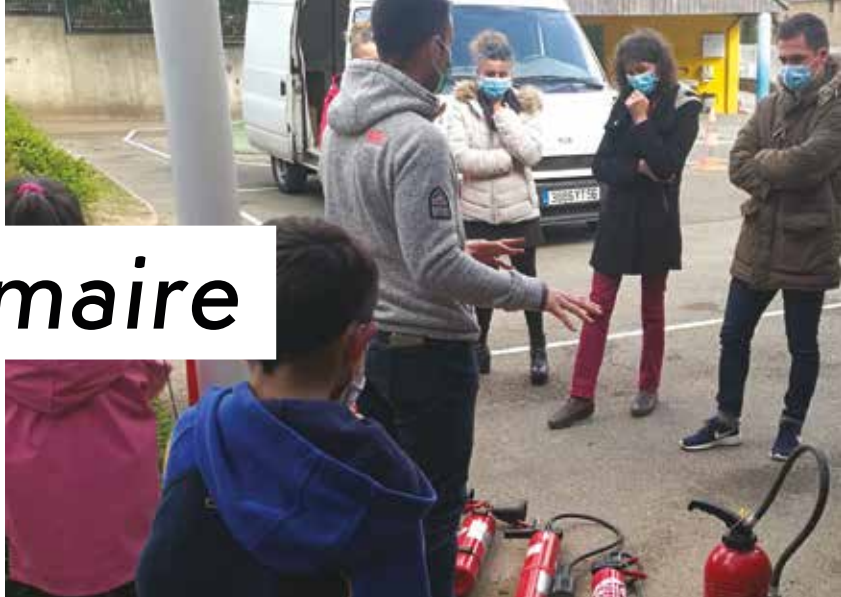
Formation continue pour les agents communaux au contact des enfants de l'école de la fontaine